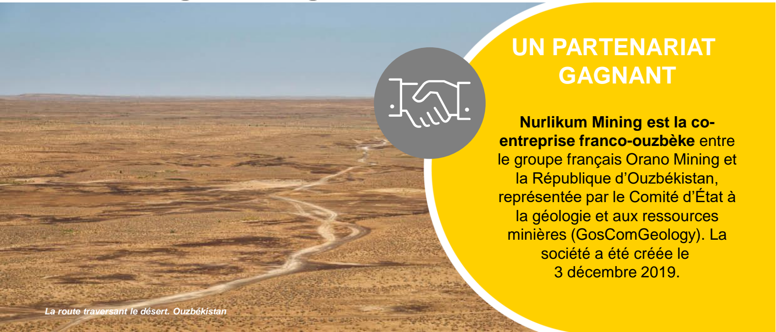
La route traversant le désert. Ouzbékistan