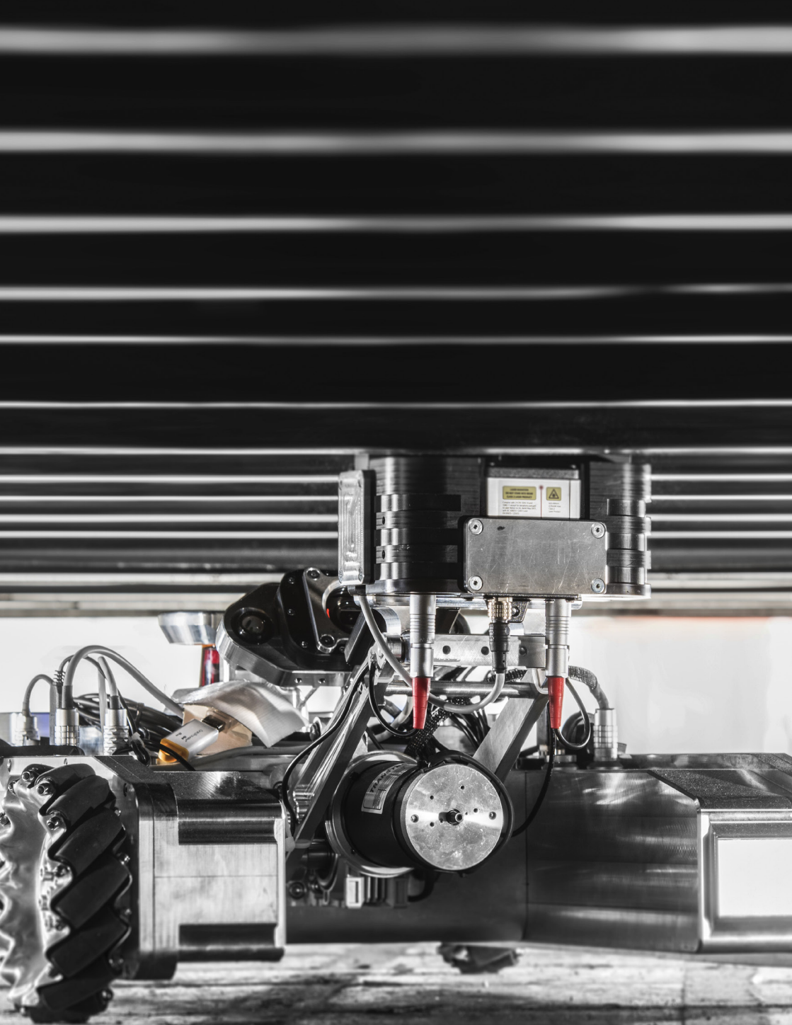
Robot RIANA SC de cartographie radiologique des conteneurs